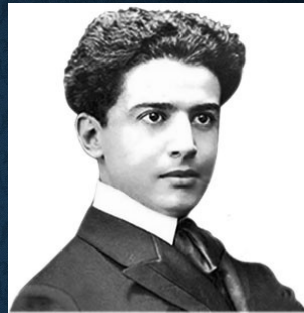
Куэльяр Мануэль Мария Понсе

Мануэль Мария Понсе родился в городе Фреслильо 8 декабря 1882 года. Сразу же после рождения сына семья переехала в город Агуаскальентес, где мальчик прожил там вместе с семьёй до 15 лет. Ещё в раннем детстве он проявил редкие музыкальные способности. Слушая игру своей старшей сестры, он однажды сел за фортепиано и без всякой музыкальной подготовки сыграл одну из услышанных только что пьес. С тех пор его стали называть «музыкальный феномен» и стали обучать музыке вместе с сестрой.