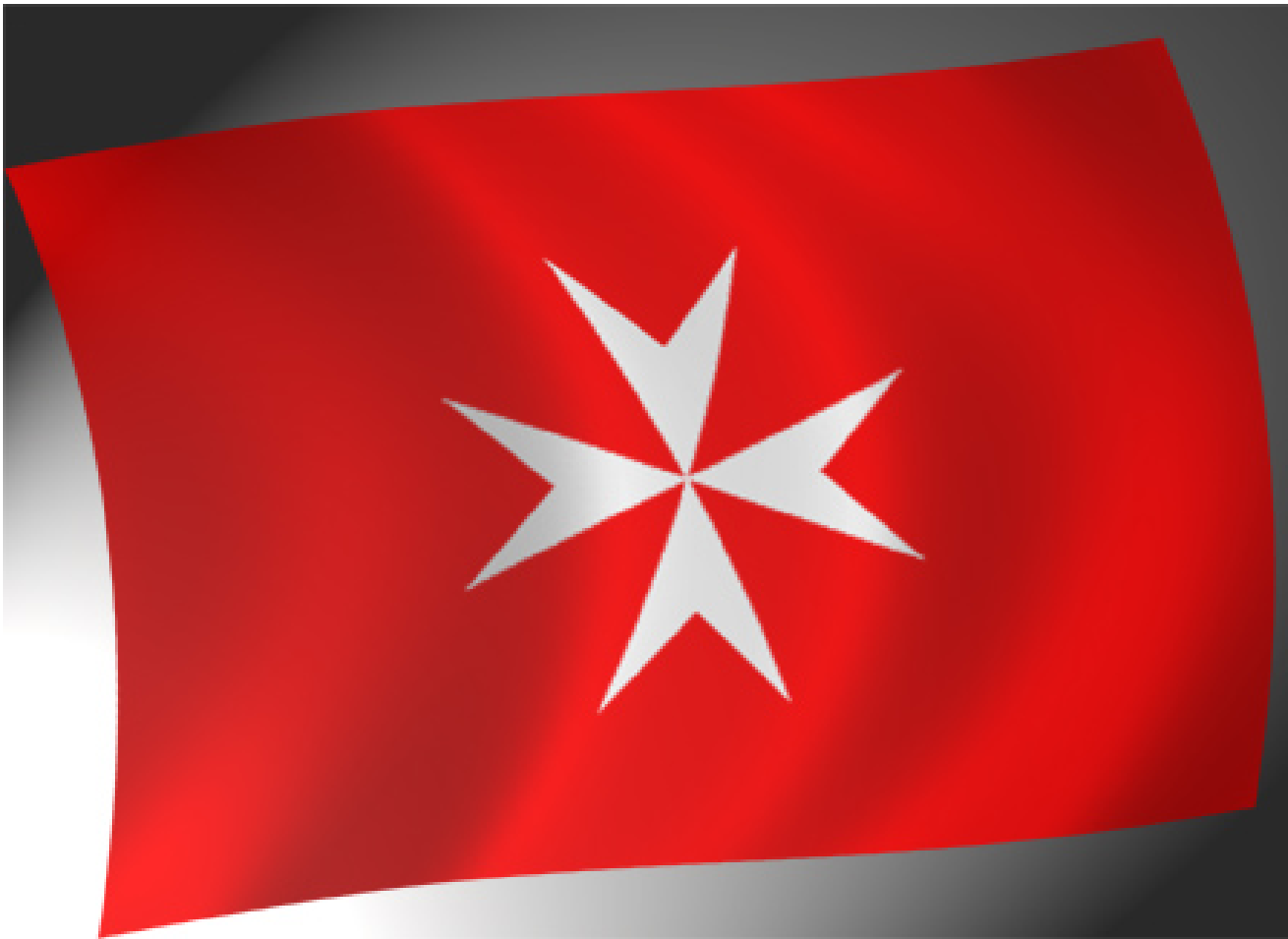
Флаг госпитальерского ордена